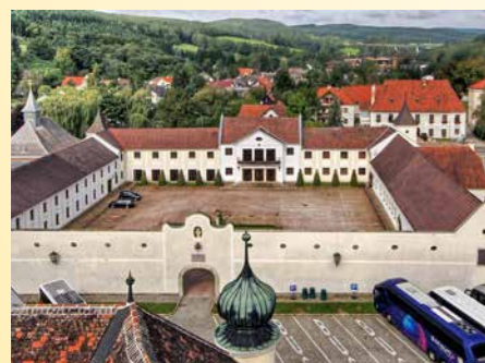
Ehemaliger Meierhof direkt beim Stift Zustand bis 2013