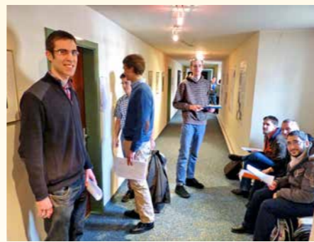
Zu wenig Platz