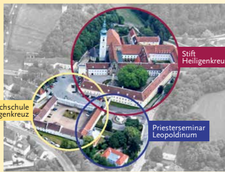
Kloster – Hochschule – Priesterseminar