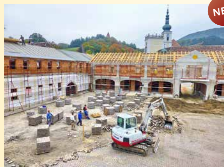
Der Hof ist derzeit noch Baustelle