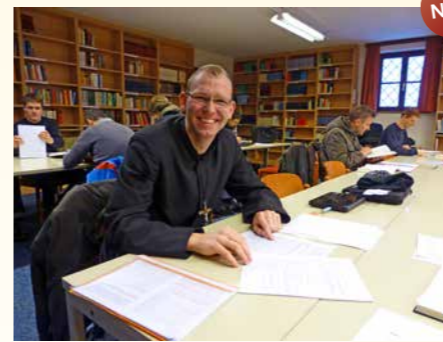
Sprachlabors für Griechisch, Lateinisch und Hebräisch