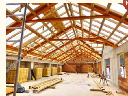
Moderne große Studienbibliothek (Platz für 130 000 Bücher)