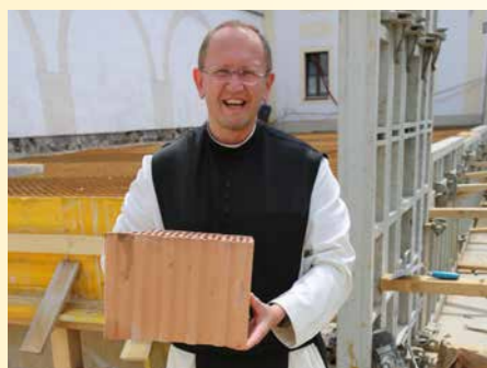
Wir müssen fertigbauen