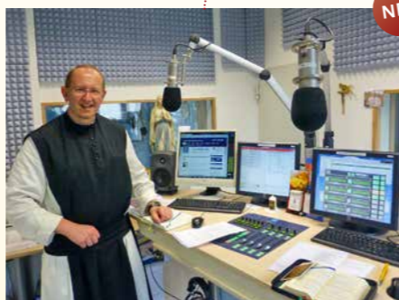
Medienzentrum (TV, Radio, Internet)