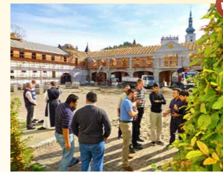
Ein Campus für zukünftige Priester